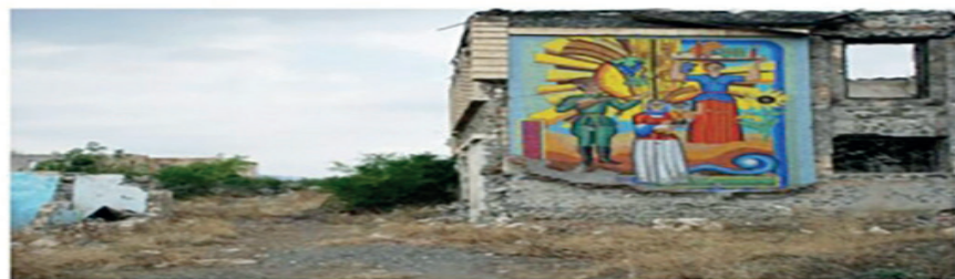
Ruinas del museo del Pan en Azerbaiyán.