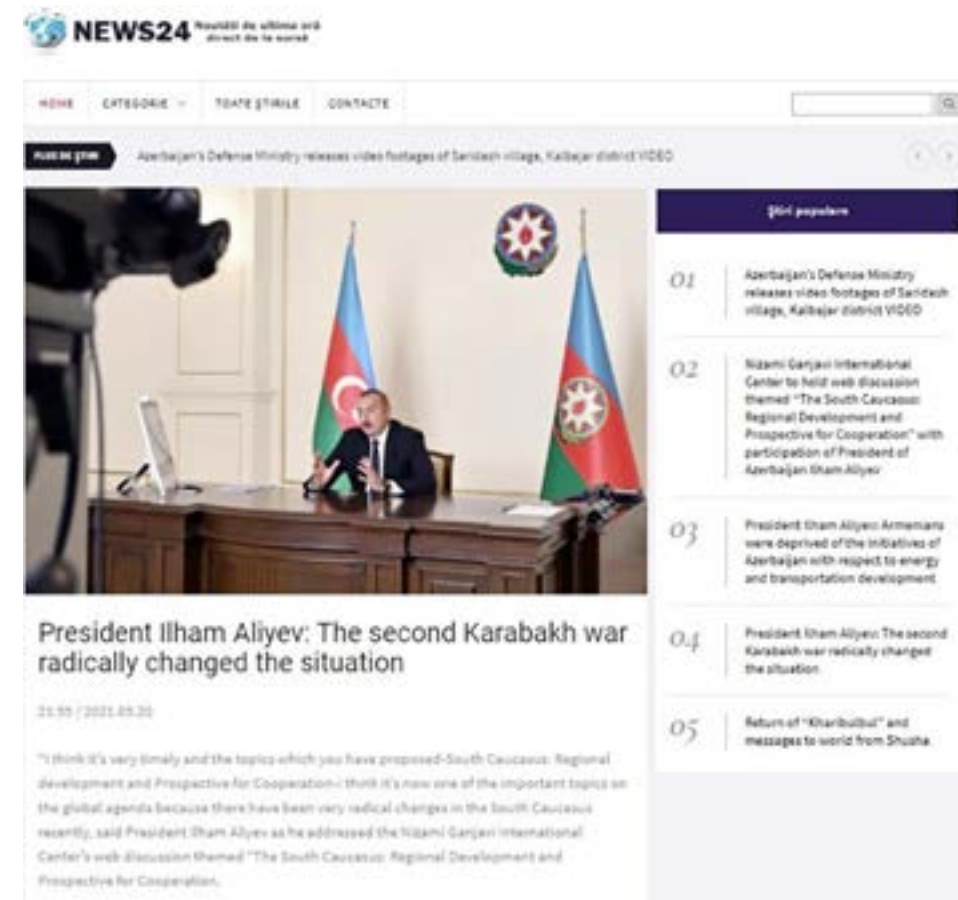
President Ilham Aliyev: The second Karabakh war radically changed the situation

Bildirilib ki, Azərbaycan beynəlxalq hüquqa əsaslanaraq, Ermənistanın 30 illik işğalına son qoyub,