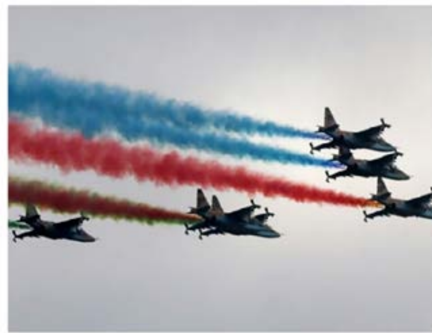
Soldiers in 22 jet fighters leave a trail in Azerbaijan national colors during a military parade marking the end of the Nagorno-Karabakh military conflict, Baku, Azerbaijan, Dec. 12, 2020

Azerbaijan swells with pride on 103rd anniversary of victory